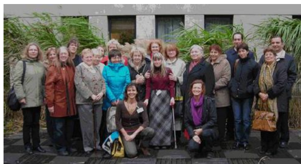
1. setkání mezinárodního týmu říjen 2009, Vídeň

zkušenosti s péčí starších žen o rodiny s handicapovanými dětmi, my přicházíme s náhledem matek a tchýní na problémy mladých žen na a po mateřské dovolené s návratem na trh práce, německé a rakouské ženy se budou vyptávat na rozdílné podmínky dnešních rodin a rodin předešlé generace a na možnost integrace emigrantek do společnosti, turecké účastnice (které měly na úvodním setkání sebou i mužské kolegy) referovaly o snaze jejich sociální organizace naučit lidi s nízkým vzděláním tradičním tureckým řemeslům.